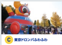
C 東京ドロンパふわふわ