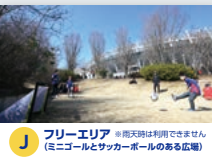
J フリーエリア ※雨天時は利用できません (ミニゴルフとサッカーボールのある広場)