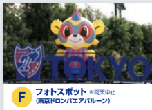
F フォトスポット ※雨天中止 (東京ドロンパエリア内)