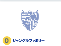
D ジャンглファミリー