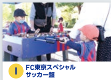
I FC東京スペシャル サッカー盤