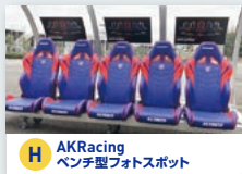
H AK Racing ペンチ型フォトスポット