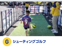
G シューティングゴルフ