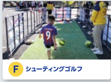
F シューティングゴルフ