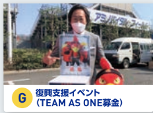
G 復興支援イベント (TEAM AS ONE募金)