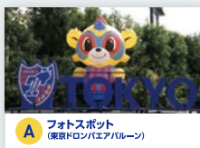
A フォトスポット (東京ドロンパエリア内)