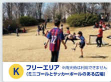
K フリーエリア ※雨天時は利用できません (ミニゴルフとサッカーボールのある広場)