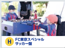
H FC東京スペシャル サッカー鑑