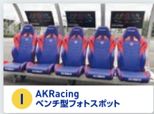
I AKRacing ベンチ型フォトスポット