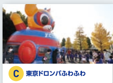
C 東京ドロンパふわふわ