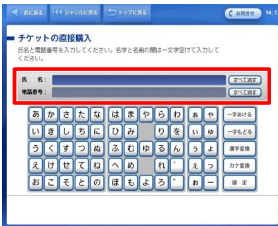
⑭ 氏名・お電話番号を入力