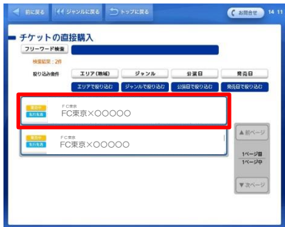
⑦ 「会員限定チケット購入」を選択。