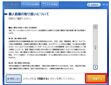
⑫ 個人情報への同意をご確認ください。