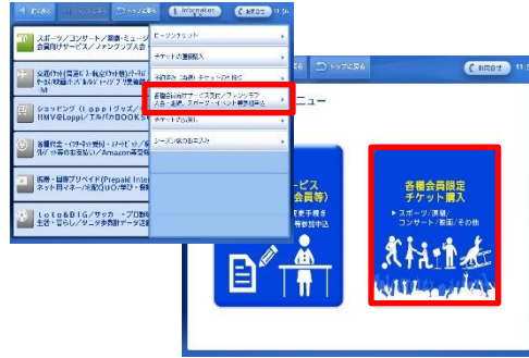
③ 「各種会員向けサービス受付/ファンクラブ入会・継続…」→「各種会員限定チケット購入」を選択