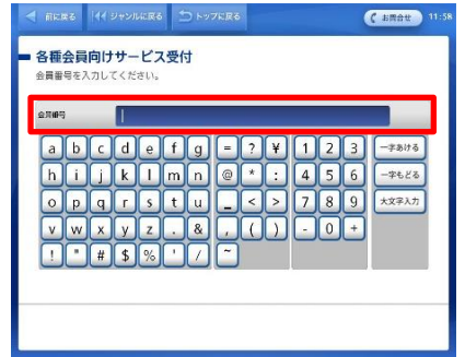
⑥ 会員番号「10桁」を入力。