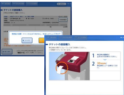
⑮ 内容を確認し問題なければ「はい」を押し、30分以内にレジへ。