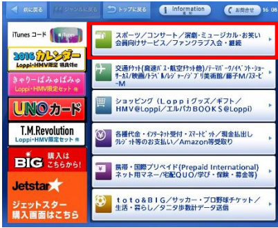
② 「スポーツ/コンサート/演劇・ミュージカル・お笑い…」を選択