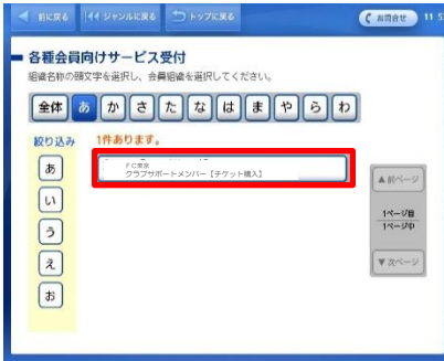
⑤ 「スポーツ」を選択→「あ」を選択し、「FC東京 クラブサポートメンバー【チケット購入】」を選択