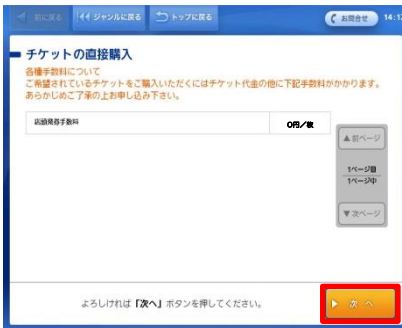
⑪ 手数料を確認し次へを選択。