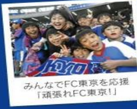
みんなでFC東京を応援「頑張れFC東京!!」