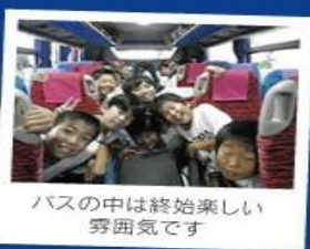
バスの中は終始楽しい雰囲気です