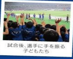
試合後、選手に手を振る子どもたち