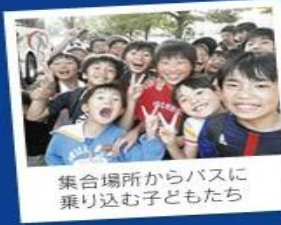
集合場所からバスに乗り込む子どもたち